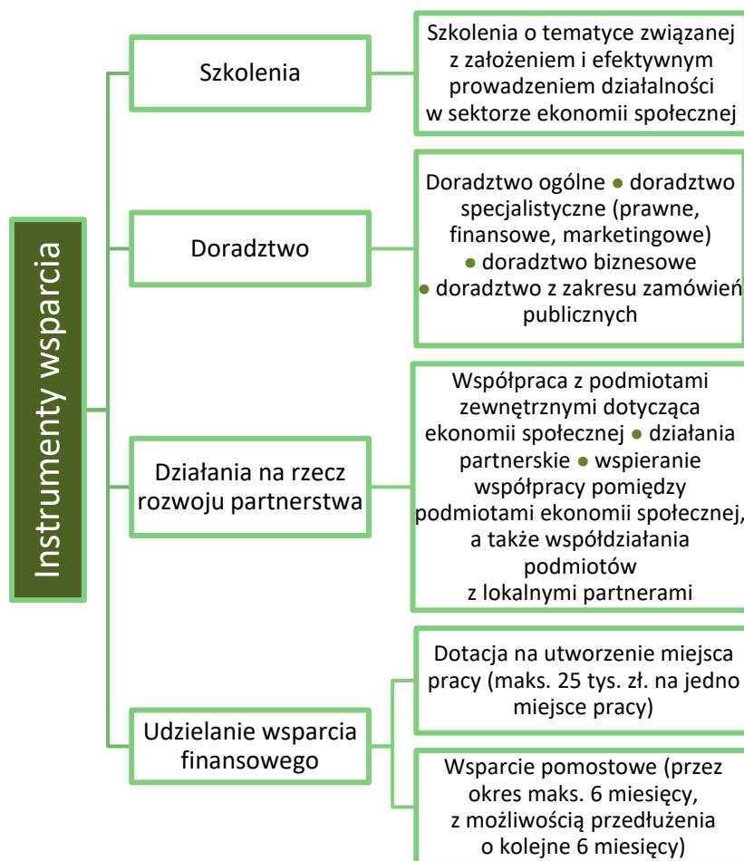
Rysunek 2. Instrumenty wsparcia oferowane przez Ośrodki Wsparcia Ekonomii Społecznej.