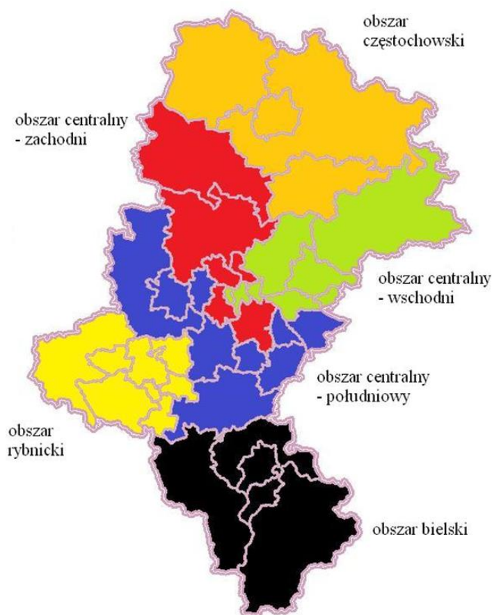
Mapa 1. Podział województwa śląskiego na obszary wsparcia przez OWES.